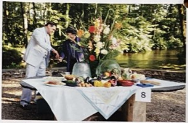
Parc du château du Saillant. Photo pique-nique été 1997.

Membre de la Fédération Française des Festivals Internationaux de Musique