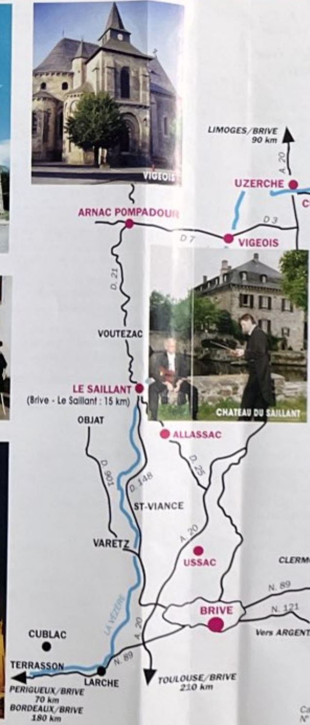
Carte Michelin N° 75 Pl 8